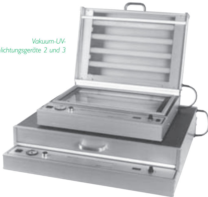
Vakuum-UV- Belichtungsgeräte 2 und 3

....zur Fertigung ein- bzw. zweiseitiger Leiterplatten