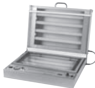
Vakuum-UV-Belichtungsgerät 1 mit aufgeklapptem Vakuumrahmen und Deckel